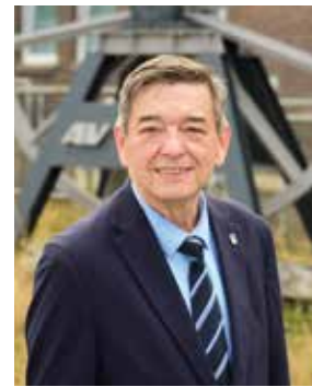
Werner Arndt Bürgermeister der Stadt Marl