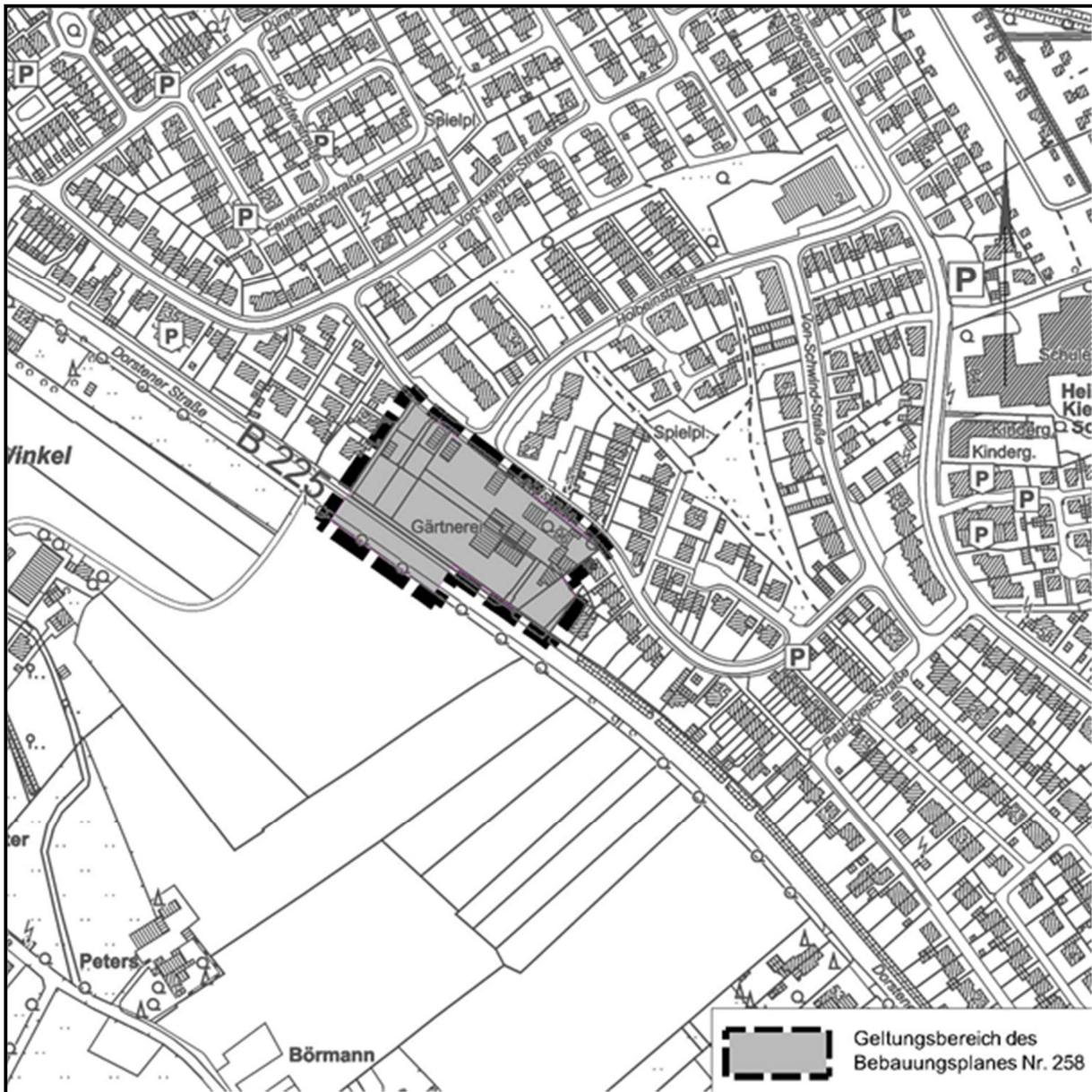
Übersichtsplan zum Geltungsbereich des Bebauungsplans Nr. 258

Der Rat der Stadt Marl hat in seiner Sitzung am 15.06.2023 den folgenden Beschluss gefasst: