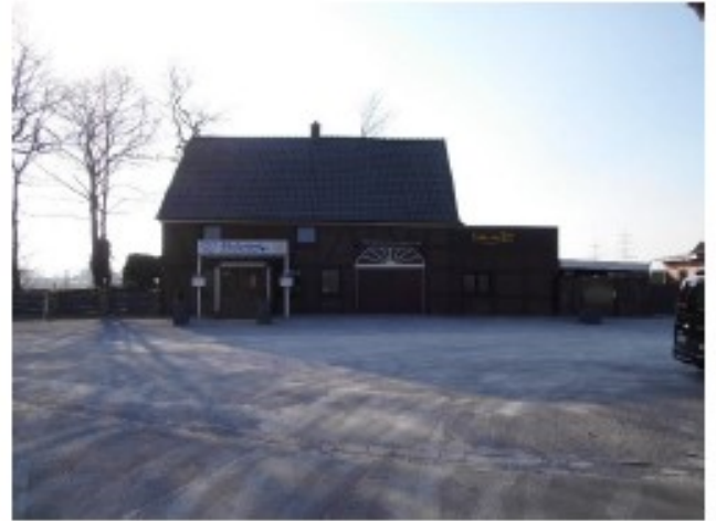
Blick nach Norden (Richtung Alt-Marl), Anschluss Radweg Bullerkotte an das Vorfeld des Hofes