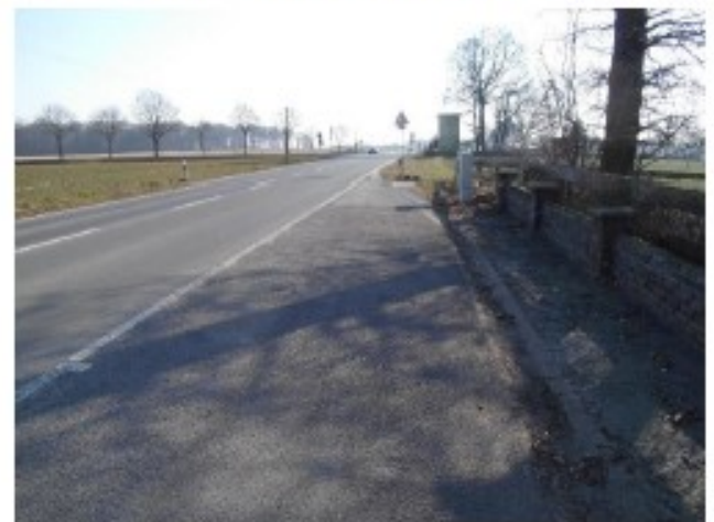
Blick nach Süden (Richtung Herten) auf das Vorfeld des Hofes Bullerkotte