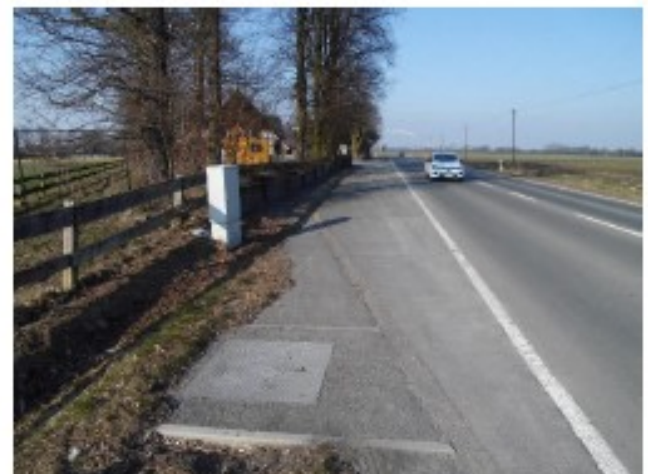
Anschlussbereich an der Stadtgrenze Herten/Marl